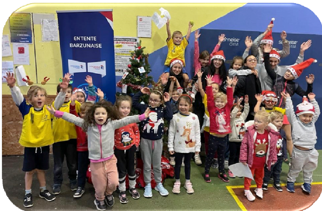
Noël des babys 2023